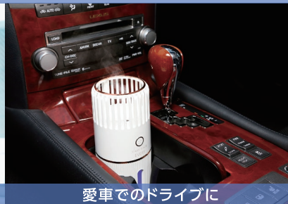
愛車でのドライブに