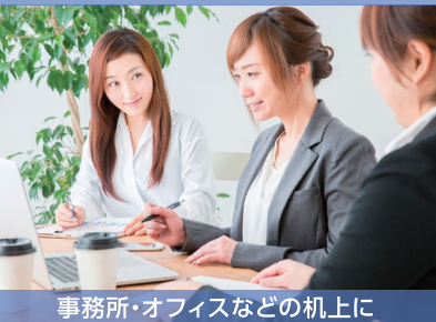
事務所・オフィスなどの机の上に