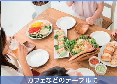
カフェなどのテーブルに